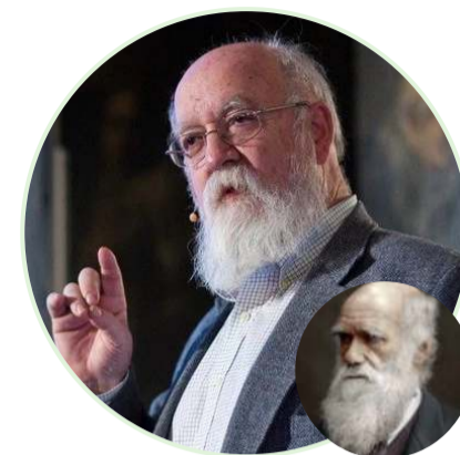
Чарлс Дарвин или Данијел Денет?